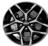
Könnnyűfém keréktárcsa 17" PLATINUM