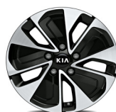
Könnnyűfém keréktárcsa 16" GOLD PLUS csomaghoz