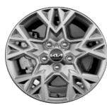
Könnnyűfém keréktárcsa 16" GOLD