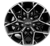
Könnnyűfém keréktárcsa 17" PLATINUM GT LINE GOLD SPORT