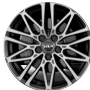
Könnyűfém keréktárcsa 18"

* Az akciós 4,99%-os THM finanszírozás zártvégű pénzügyi lízing konstrukcióban, fix kamatozással, 24-72 hónapos futamidővel, legalább 30% önerő megfizetésével érhető el. A THM meghatározására a finanszírozási feltételek és a hatályos jogszabályok figyelembevételével került sor. A THM mértéke a finanszírozási feltételek változásától függően módosulhat, illetve eltérő mértékű lehet. Fix kamatozás következtében a futamidő alatt a havi lízingdíjak összege nem változik. A Lízingbevevőnek kötelező az általa kiválasztott biztosítóval teljes körű casco biztosítást kötnie a finanszírozott gépjárműre akként, hogy a biztosítás társbiztosítottja a Merkantil Bank Zrt., mint Lízingbeadó és tulajdonos legyen. A finanszírozás további feltételeiről, illetve a felmerülő kockázatokról a Merkantil Bank Zrt. Gépjármű Zártvégű Pénzügyi Lízing Üzletszabályzatából, Hirdetményeiből és az ügyfeleknek szóló Tájékoztatókból tájékozódhat, továbbá ezen dokumentumokból tájékozódhat a tárgybani finanszírozástól eltérő nem akciós finanszírozás feltételeiről is, amelyek megtekinthetők a Merkantil Bank Zrt. honlapján vagy székhelyén. Részletes tájékoztatásért forduljon Kia Márkakereskedőjéhez, aki mint közvevő a Merkantil Bank Zrt. finanszírozó képviselőjében jár el! Az akció visszavonásig érvényes.