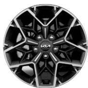
Könnyűfém keréktárcsa 17"