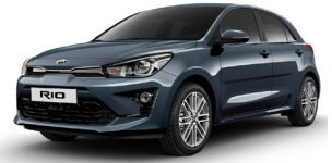
Smoke Blue (EU3) METÁL