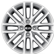
GOLD 15" könnyűfém keréktárcsa