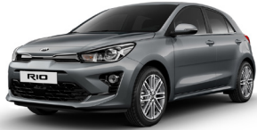
Perennial Grey (PRG) METÁL