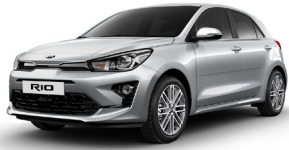
Silky Silver (4SS) METÁL