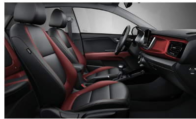
GOLD, PLATINUM opcionális műbőr/szövet PIROS-ANTRACIT ( PCP )