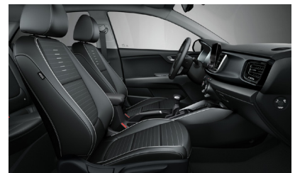
GT LINE sztenderd műbőr/szövet