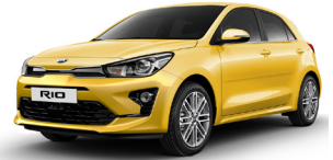
Most Yellow (MYW) METÁL