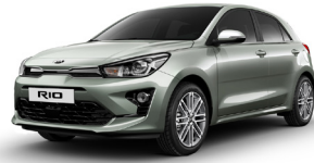
Urban Green (URG) METÁL