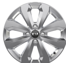
PLATINUM 16" könnyűfém keréktárcsa