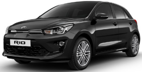
Aurora Black Pearl (ABP) METÁL