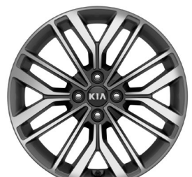
GT-LINE 17" könnyűfém keréktárcsa