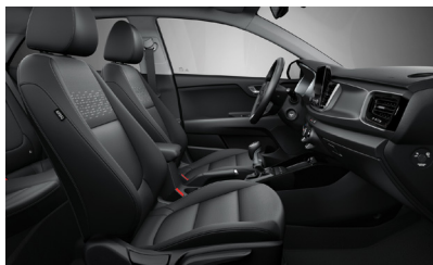
GOLD, PLATINUM sztenderd fekete szövet