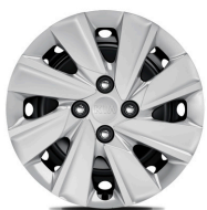
SILVER, SILVER VISION 15" acél keréktárcsa díztárcsával