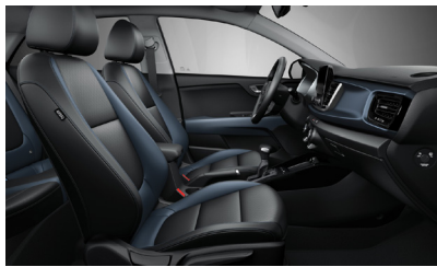
GOLD, PLATINUM opcionális műbőr/szövet KÉK-ANTRACIT ( KCP )