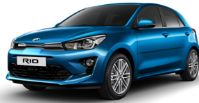
Sporty Blue (SPB) METÁL