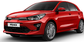
Signal Red (BEG) METÁL