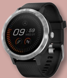
Okosóra B6 695 8848