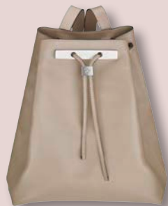
Női táska B6 695 5034