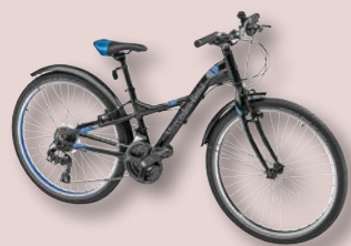
Gyerekkerékpár B6 645 0155