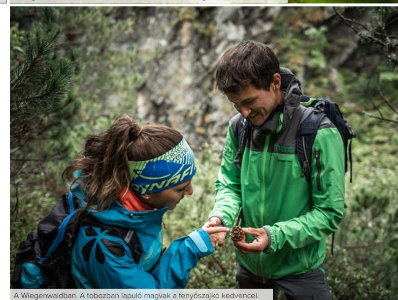
A Wiegenwaldban. A tobozban lapuló magvak a fenyőszajkó kedvencel.

Természetvédelmi őr vezet el a nemzeti park legöregebb cirbolyafenyő erdejébe, a Wiegenwaldba. Kezdetben lucfenyő-erdőben visz az út, aztán megritkulnak a fák, kiérünk a lápvidékre. Feketén csillogó lápi tavacszkák mentén járunk, a fákon neonsárgán virít a farkas-zuzmó. Kis szerencsével kis fekete alpesi szalamandrát láthatunk. Ember nemigen jár erre. Vigyázni kell, hogy ne zavarjuk meg a különleges természeti élőhely egyensúlyát. Valódi kincs ez a kb. 1800 méter magasan fekvő erdő, már a hercegérsekek idejében is különleges védelem járt neki. A páfrányok, mohák, zuzmók világában álló hatalmas fák közt ezeréves is akad. Még feljebb a törpefenyők birodalmába jutunk, alattunk a Grünsee tó, túloldalán a távolban a Weisssee gleccscservidék különleges hegyi szállodája, a Rudolfshütte. Ez az egyetlen háromcsilagos szálloda az Alpokban, ahova kizárólag gyalog vagy hegyi felvonóval lehet csak eljutni! 2315 méteres magasságban épült, Rudolf trónörököséről kapta a nevét.