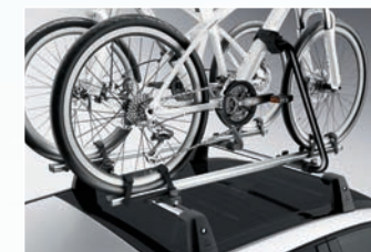
Kerékpártartó (alaptartó nélkül)