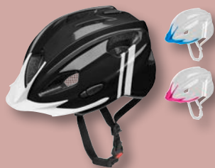
Gyerek kerékpársisak B6 645 0076