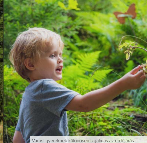
Városi gyerekeknek különösen izgalmas az erdőjárás

A salzburgi erdők nem túl sűrűek, a táblákkal jelölt túrautakon veszélytelenül indulhatunk felfedezőútra. A zöldben kevésbé megterhelő a sport, és a hatása is jobb. A salzburgi régiók kijelölt hegyi kerékpárútjainak hetven százaléka erdőben vezet. Tájékozódjunk a lehetőségekről! Induljunk szervezett távtúrára, és éjszakázzunk függőágban az erdő mélyén, fürödjünk meg a kis erdei tavakban, patakokban. Vigyük el a gyerekeket az erdei csúszdaparkokba, erdei hintákhoz, a lombkorona sétányra. Élvezni fogják a tematikus túrákat és a vadmegfigyelést a nemzeti park hegyóriásai közt.