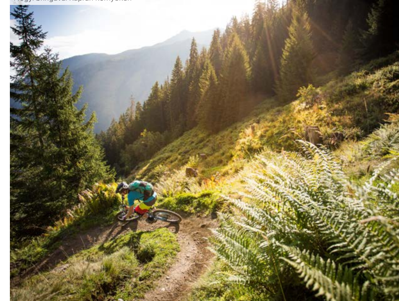
Hegyi bringával Kaprun környékén