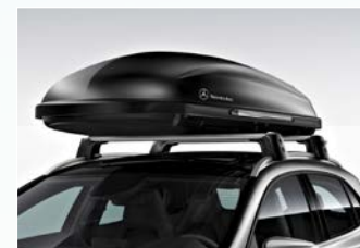
Tetőbox 400L fekete

Annak érdekében, hogy hozzájáruljunk élményekkel teli tavaszához, tekintse meg az új B-osztályra összeállított termékjavaslatainkat.