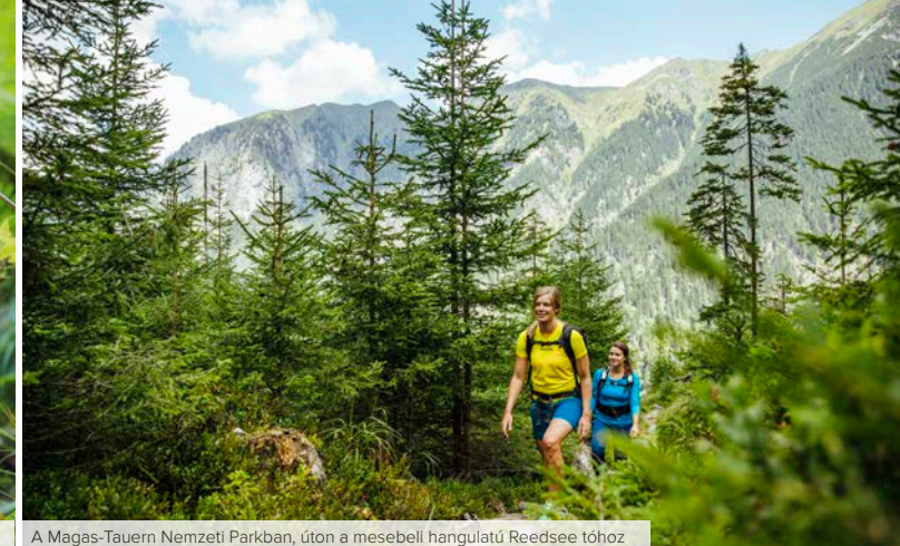
A Magas-Tauern Nemzeti Parkban, úton a mesebeli hangulatú Reedsee tóhoz

“Amikor az erdőn jársz, és rábukkansz valahol egy forrásra, ülj le melléje csöndesen és figyelj. Nagyon csöndes légy, és akkor hallani fogod a zöld ruhás tündérke hangját a surranó vízből. Ha pedig jó füled van, és érted az erdő nyelvét, akkor meghallhatod azokat a csodaszép meséket, amiket a forrás, a csermely, a patak tündére elmond ilyenkor a fáknak.” (Wass Albert)