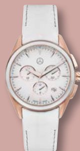
Női óra B6 695 4170