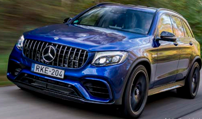
A kép illusztráció.

AZ AMG OPTIKAI ÁTÉPÍTÉS RÉSZEI GLC (2019) ESETÉN: