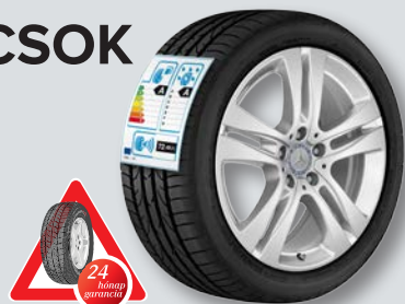
A kép illusztráció, a rajta található érték mintaérték.

Beköszöntött a tavasz, ezzel együtt pedig a nyári időszámítás kezdete. Gyakran ismételt információ, hogy hétfokos napi átlaghőmérséklet mellett már nincs szükség a téli gumikra, így a meleg napok beköszöntével eljött a csere ideje. A téli abroncsok lágyabbak mint a nyáriak, könnyebben túlmelegszenek, így kevésbé tapadnak a meleg aszfalton, valamint jobban is kopnak.