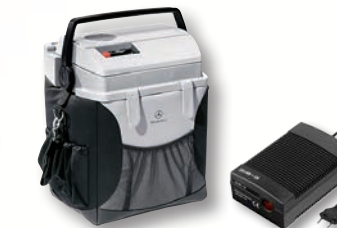
Hűtőláda 24 L