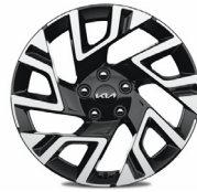
18" könnyűfém keréktárcsa