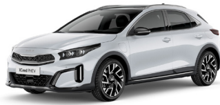
Deluxe White (HW2)