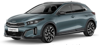
Yuca Steel Gray (USG)