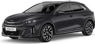
Penta Metal (H8G)