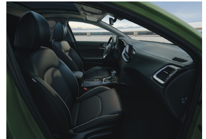
Opcionális BŐR csomag bőr kárpitozással X-PLATINUM felszereltséghez