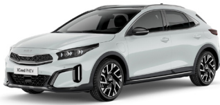
Cassa White (WD)