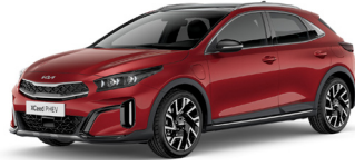
Infra Red (AA9)