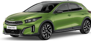
Celadon Spirit Green (CE6)