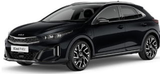
Black Pearl (1K)