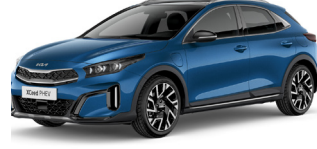
Blue Flame (B3L)