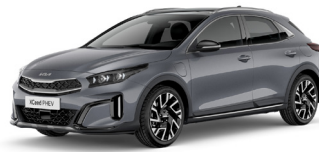
Lunar Silver (CSS)