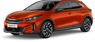
Orange Fusion (RNG)