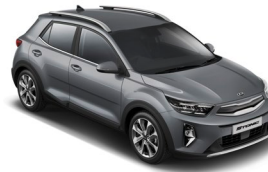
Perennial Grey (PRG) Metál