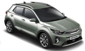
Urban Green (URG) Metál GT-Linehoz nem elérhető