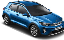
Sporty Blue (SPB) Metál