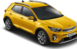
Most Yellow (MYW) Metál