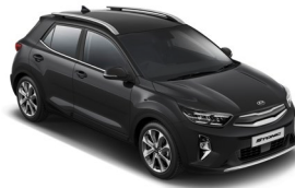
Aurora Black Pearl (ABP) Metál