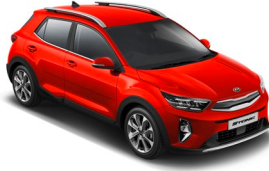
Signal Red (BEG) Metál