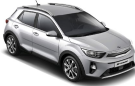
Silky Silver (4SS) Metál