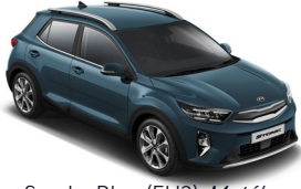
Smoke Blue (EU3) Metál GT-Linehoz nem elérhető