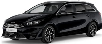
Black Pearl (1K)