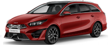
New Infra Red (AA9)