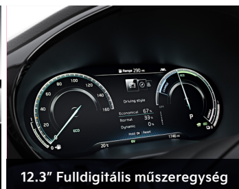
12.3" Fulldigitális műszeregység