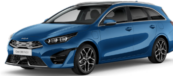
Blue Flame (B3L)