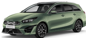
Expreience Green (EXG)