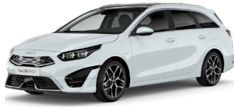
Cassa White (WD)