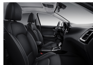
Opcionális BÖR csomag PLATINUM felszereléshez