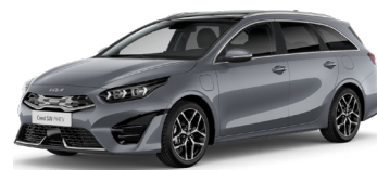
Lunar Silver (CSS)