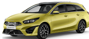
Splash Lemon (G2Y)