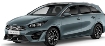
Yucca Steel Grey (USG)