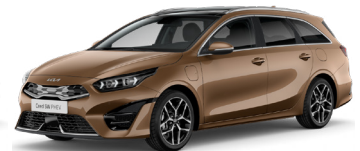
Machined Bronze (M6Y)