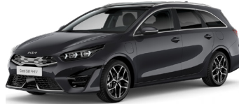
Penta Metal (H8G)