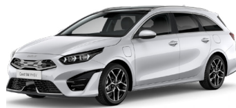
Deluxe White Pearl (HW2)