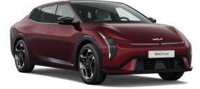
Magma Red (OVR) (Prémium Metál)