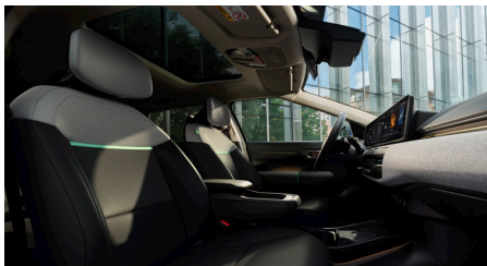
EARTH / EARTH PLUS Fekete Vegán bőr szövet ülésárpit