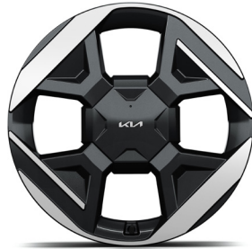
19" könnyűfém keréktárcsa (XM) Earth Plus opció