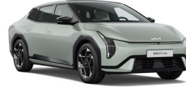
Morning Haze (ACW) (Prémium Metál)