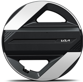
17" könnyűfém keréktárcsa (VA) Earth / Earth Plus