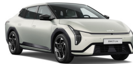
Ivory Silver (ISM) (Matt)