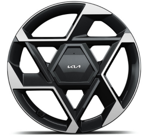
19" könnyűfém keréktárcsa (XP) GT-Line