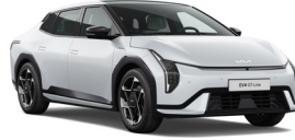
Snow White (SWP) (Metál)