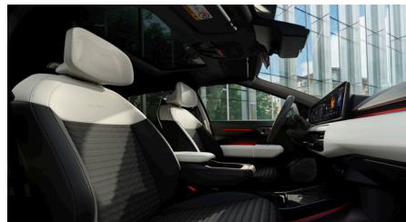
GT-LINE Vegán bőrlélek