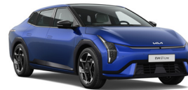
Yacht Blue (ACY) (Matt)