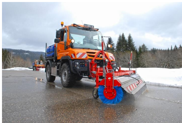
A kép csak illusztráció