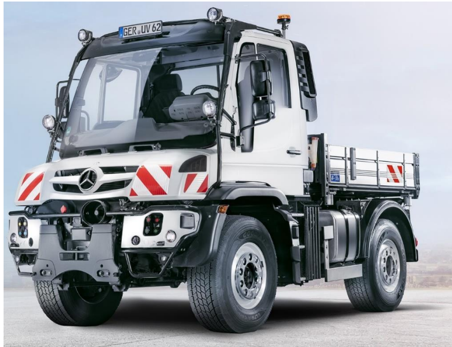
A kép csak illusztráció