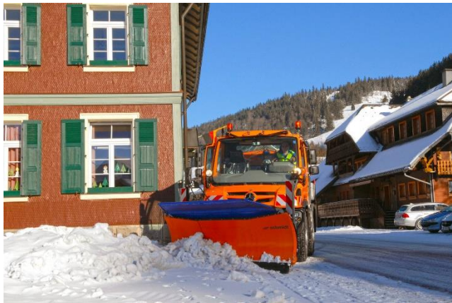
A kép csak illusztráció